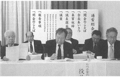
役員 報告事項 議長退任 会長挨拶 会長あいさつ 閉会のことば 閉会のことば