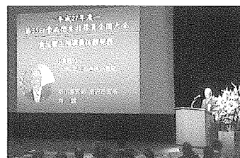
指導員全国大会体験発表