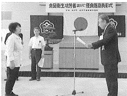
金沢市食品衛生協会 会長表彰